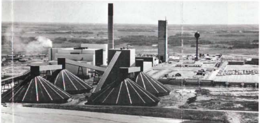
L'industrie de la potasse prend, dans le sud de la Saskatchewan, des proportions impressionnantes. La capacité annuelle des quatre mines exploitées en 1967 est de 4,900,000 tonnes, et une fois terminé l'aménagement des six nouvelles mines déjà en voie de construction, le Canada deviendra, au début des années 1970, le plus grand producteur de ce minerai dans le monde.